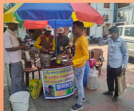
IRCS, Kandi sub district branch, Odisha delivered ORS-based purified drinking water to the needy