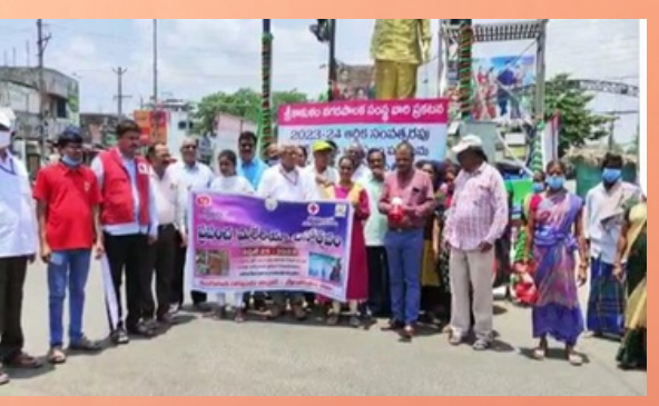
Awareness rally was held on World Malaria Day at Srikakulam district branch, Andhra Pradesh