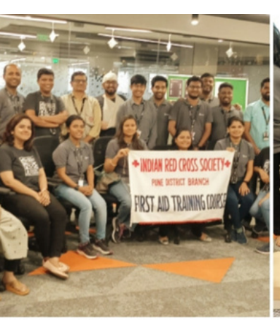
First aid training, Pune, Maharashtra