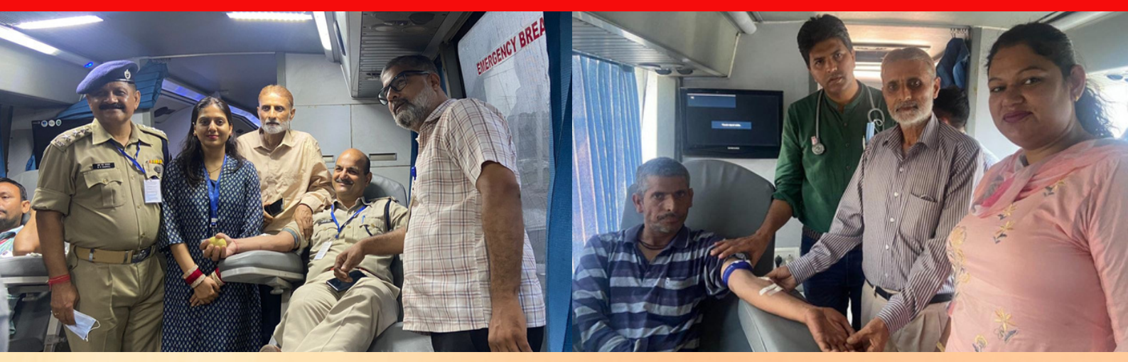
Blood donation camps were organized with different agencies by the IRCS of Jammu division. The partner organizations included like BSF, Airport Jammu and Sant Nirankari Mandal and others.