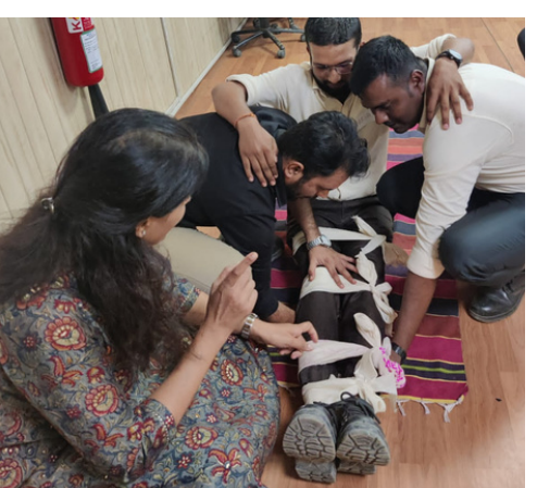
Basic first aid training was conducted for the officers and workers of HCC, of Mumbai Coastal Road Project, Mumbai, Maharashtra