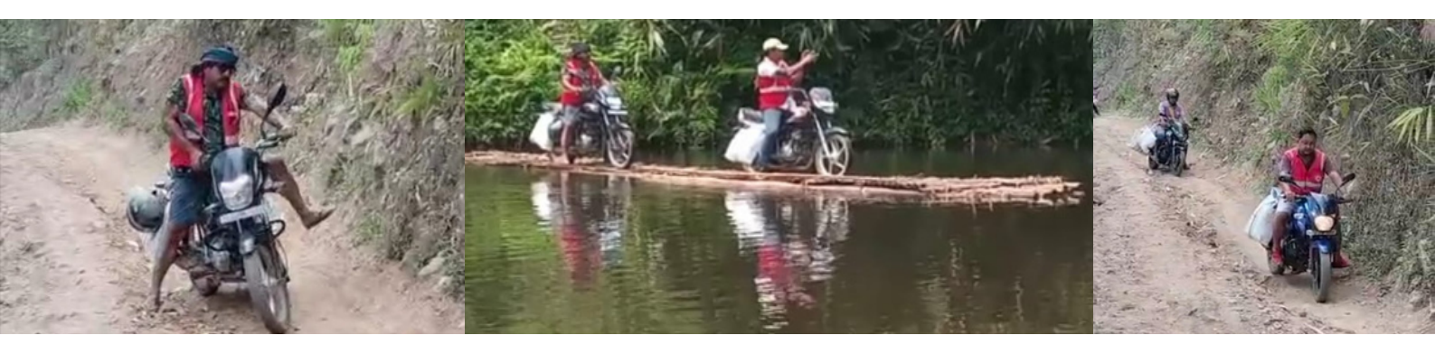
Red Cross volunteers extended humanitarian services to the affected population in one of the remotest terrains in Karbianglong district of Assam