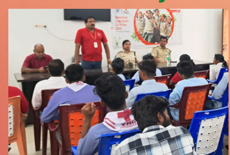
Earth Day was celebrated at Kantamal, Boudh, Odisha in collaboration with Save the Children (NGO)