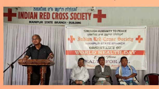
Celebration of World Health Day, Manipur state branch