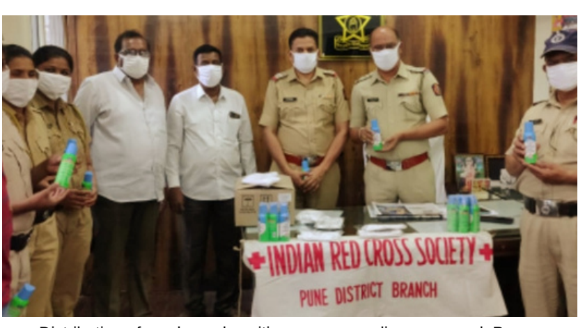
Distribution of masks and sanitizers among police personnel, Pune, Maharashtra