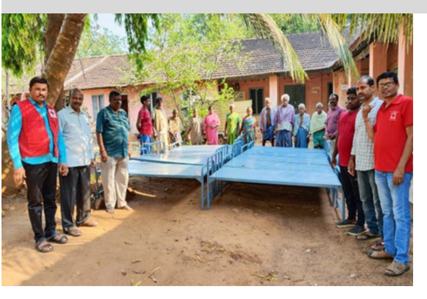
The Srikakulam district branch, Andhra Pradesh donated ten iron beds worth Rs 1,20,000 to the district Leprosy and Tuberculosis control office.