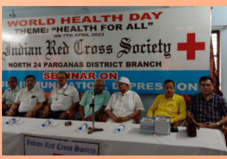
Celebration of World Health Day, North 24 Parganas, West Bengal