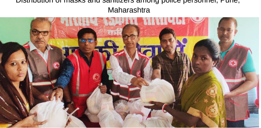
Distribution of nutritious food to TB patients, Katihar, Bihar