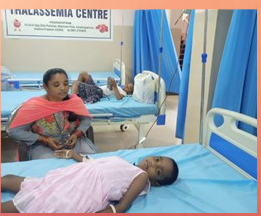
19 thalassemic patients were transfused blood at Visakhapatnam, Andhra Pradesh