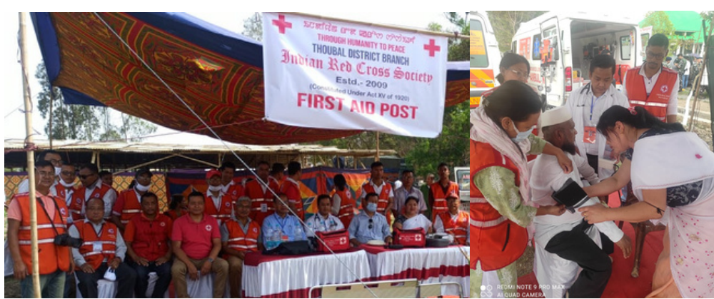
First aid post, Thoubal district branch, Manipur