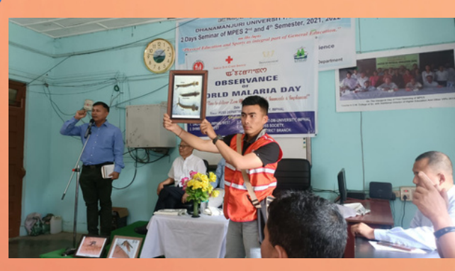
Observation of World Malaria Day by IRCS, Imphal west district, Branch