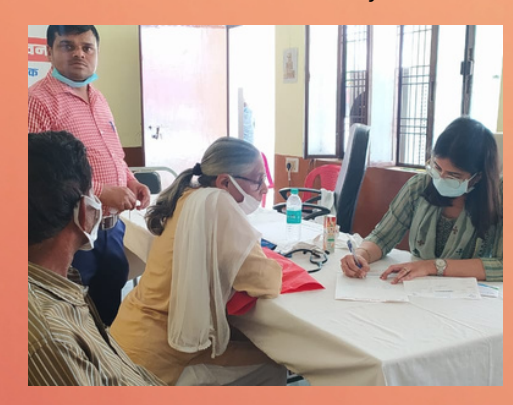
Health checkup camp, Hardoi, Haryana