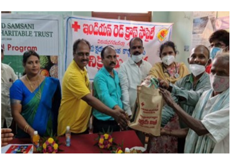
Distribution of nutritional kits to Tuberculosis patients by Vizianagaram district branch, Andhra Pradesh