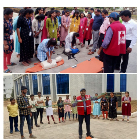
IRCS, Davengere district branch, Karnataka along with GMIT Engineering college conducted a workshop on first aid for volunteers of NSS and YRC.