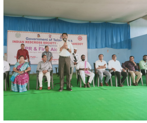
First aid training, Jukkal, Kamareddy district, Telangana