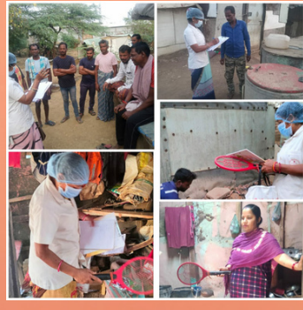
An awareness camp to prevent mosquito infestation was held at Kholi area of Alang, Bhavnagar, Gujarat, on the occasion of World Malaria Day