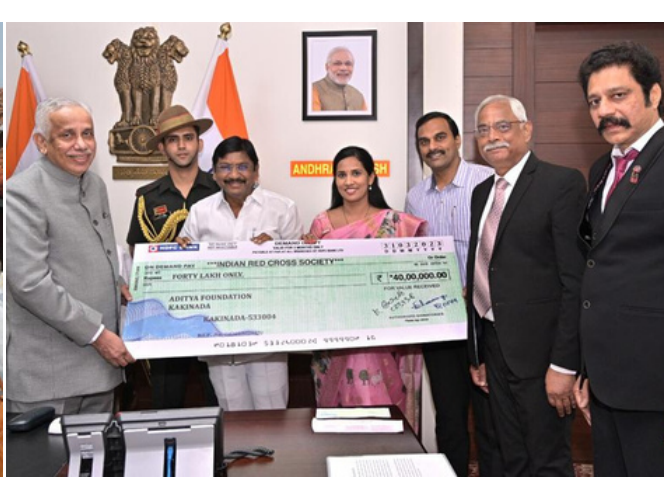
Andhra Pradesh Red Cross branch received Rs. 40 lakhs from Hon'ble Governor, S. Abdul Nazeer