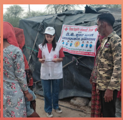
TB awareness program was conducted in the slum areas of Sirsa district, Haryana.