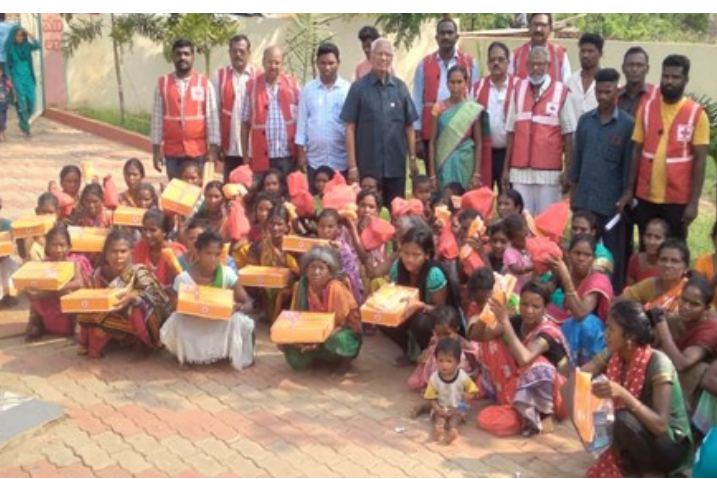
Distributed hygiene kits to the tribal people at Parvathipuram Manyam, Andhra Pradesh