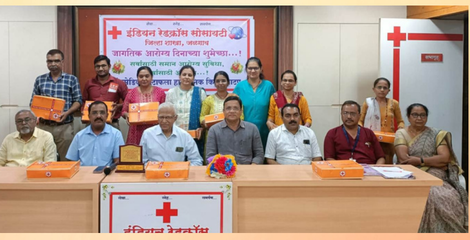
Distribution of hygiene kits on the occasion of World Health Day to Paramedics at various hospitals in Jalgaon, Maharashtra