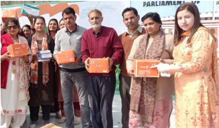
Distribution of sanitary napkins and hygiene kits to the girl students of Govt. schools of Jammu