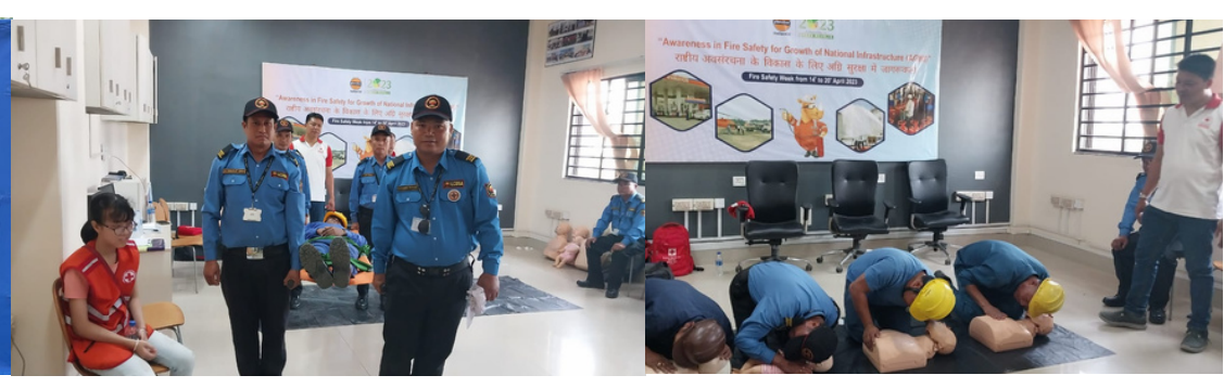
Fire safety week was celebrated at Imphal in the presence of district administration, Manipur fire service, Factories dept. officials, Mutual aid members