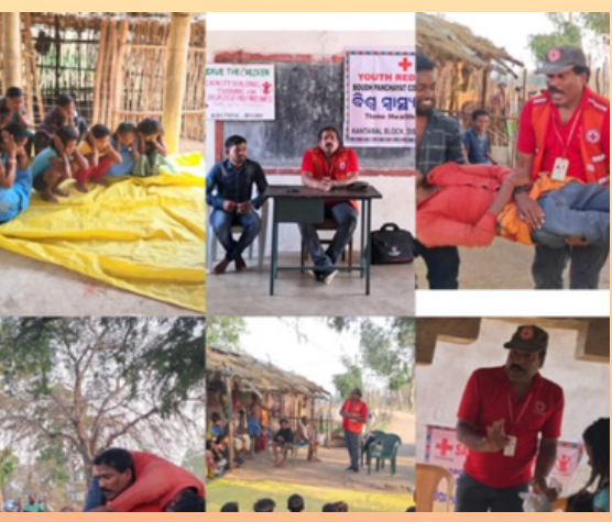
Disaster preparedness and basic first aid training were held at 4 villages of Boudh, district, Odisha on the occasion of World Health Day