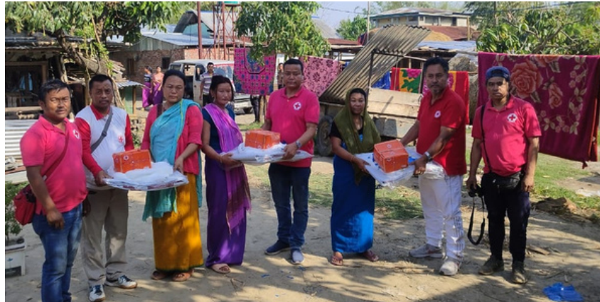
IRCS, Manipur state branch handed over tarpaulins, mosquito nets and hygiene kits to needy and vulnerable