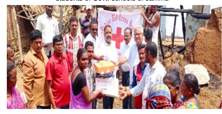
Provided immediate relief and groceries to the victims of the fire accident at Srikakulam District Branch