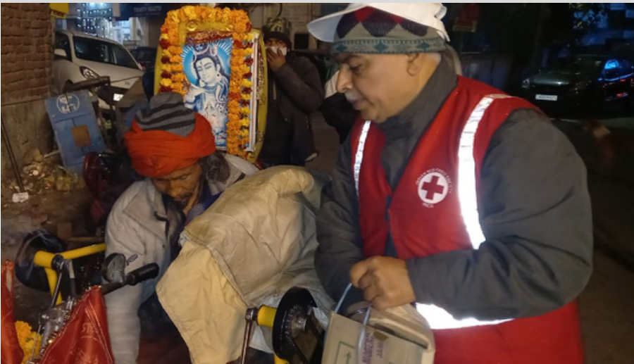
Distribution of relief items and blankets to poor and needy in the slums of Jammu