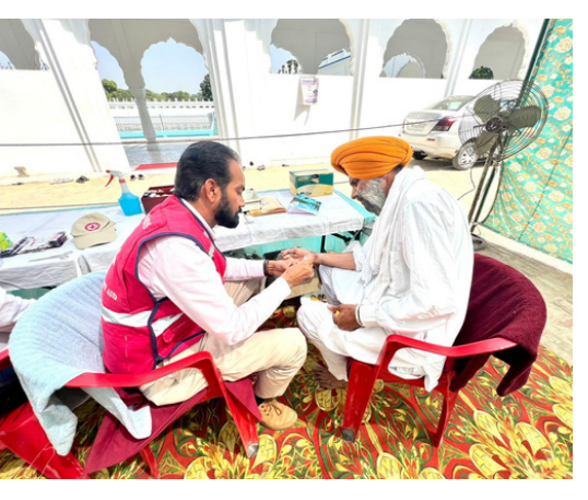
First aid services were provided to pilgrims of Vaisaakhi fair at Talwandi Sabo district, Bathinda, Punjab