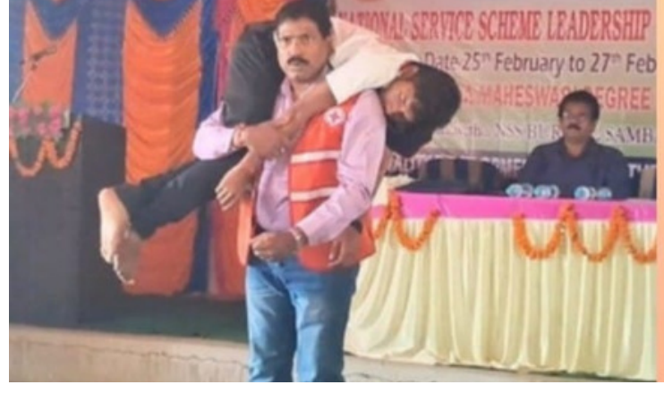
Disaster management training, MM College, Baunsuni, Boudh, Odisha