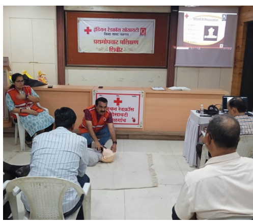
First aid training, Jalgaon, Maharashtra