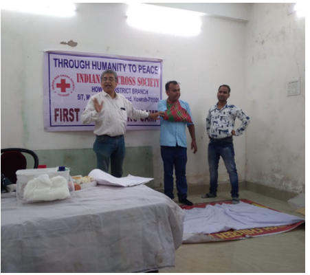
First aid training, Howrah district branch, West Bengal