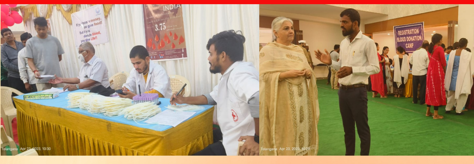
Blood donation camp organised at Nirankari Bhawan, Hyderabad, Telangana