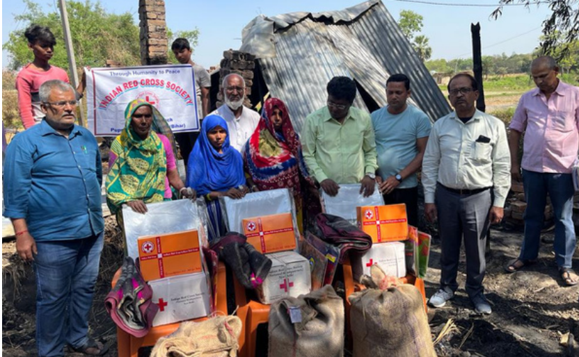
Distribution of relief items to the fire victims of Pupri, Bihar