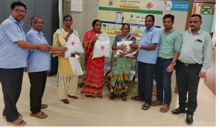
Distribution of nutritional kits, Colaba ward, Mumbai, Maharashtra