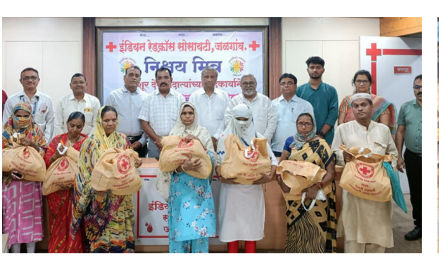
Distribution of nutritious food to T.B. patients, Jalgaon, Maharashtra