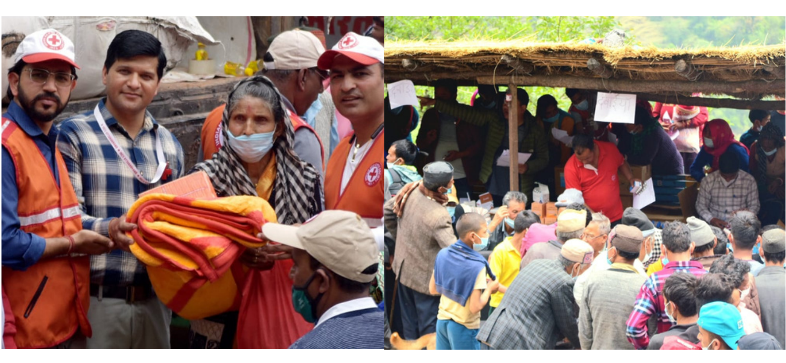
Distribution of relief items including blankets, hygiene kits and medicines to needy, Uttarakhand