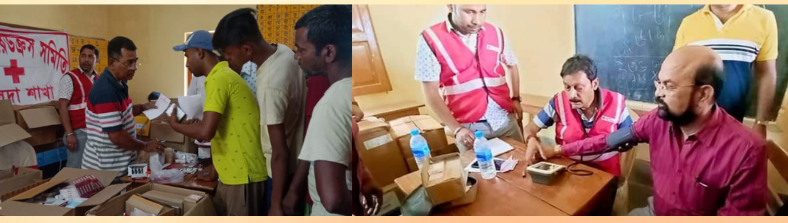
Health awareness & health checkup camp was held at Gopalpur Primary School campus, Malda district branch, West Bengal