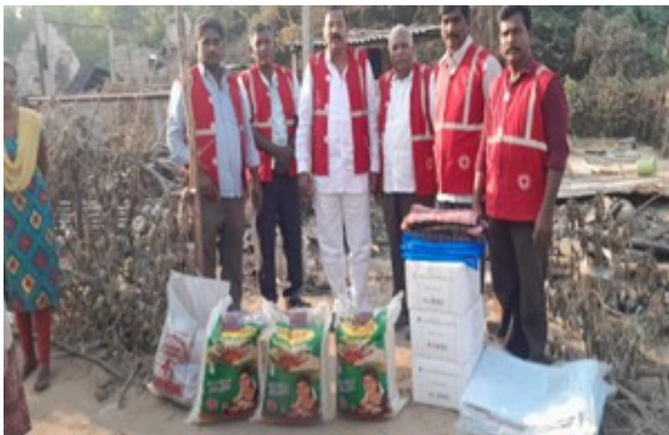
Relief materials and other essential items were provided to the fire victims at Visakhapatnam, Andhra Pradesh