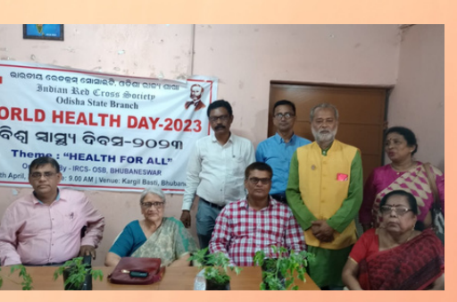
Celebration of World Health Day, Bhubaneswar Odisha