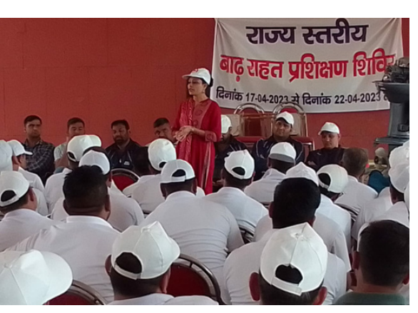
Flood relief training camp was held at Brahma Sarovar, Kurukshetra, Haryana